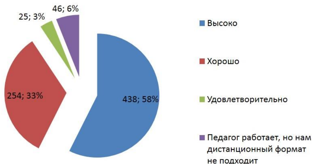
Рисунок 5 – Оценка родителями работы педагогов МАОУ ДО ДЮЦ «Звездочка» при реализации занятий в дистанционной форме

Вывод: Реализацию занятий в дистанционной форме (с применением электронного обучения) необходимо организовывать исходя из педагогической целесообразности, например, при реализации индивидуальных образовательных маршрутов (в т.ч. при пропуске ребенком занятий по состоянию здоровья) или самостоятельного изучения дополнительного материала детьми, а также для организации познавательного семейного досуга.