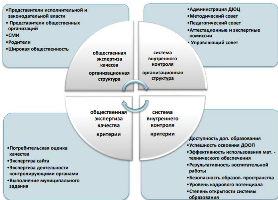
Рисунок 1 – Модель ВСОКО МАОУ ДО ДЮЦ «Звездочка» г. Томска

Мониторинг качества образования проводится ежегодно по следующим параметрам: 1. Кадровое обеспечение. 2. Программно-методическое обеспечение. 3. Уровень полноты реализации образовательных программ. 4. Уровень освоения обучающимися образовательных программ. 5. Сохранение контингента обучающихся. 6. Уровень удовлетворенности качеством образовательных услуг