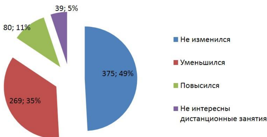
Рисунок 2 – Оценка родителями интереса детей к проведению занятий в дистанционной форме

Анализ рисунка 2 позволяет сформировать суждение о том, что мнения родителей относительно интереса детей к проведению занятий в дистанционной форме распределились практически поровну.