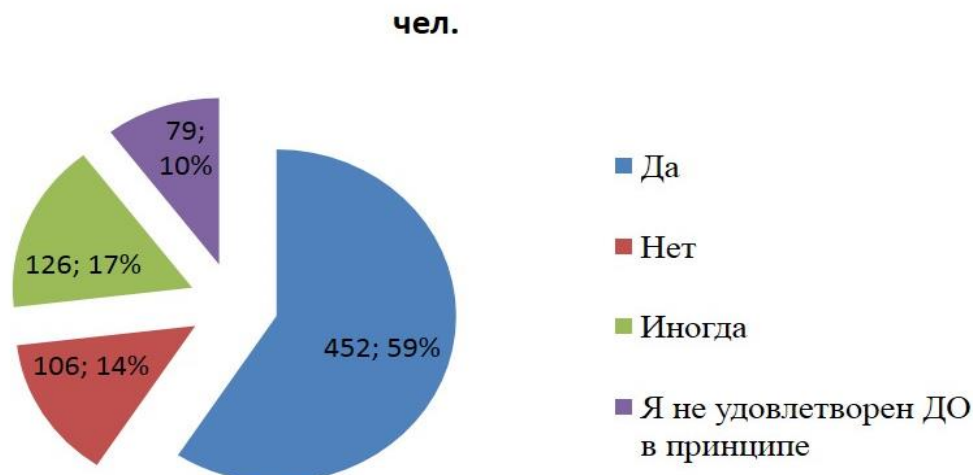
Рисунок 4 – Удовлетворенность родителей качеством реализации занятий в дистанционной форме

При анализе рисунка 4 следует отметить группу родителей (14%), которые не удовлетворены качеством занятий, проводимых в дистанционной форме на базе МАОУ ДО ДЮЦ «Звездочка» г. Томска. Именно эти родители в целом против дистанционного образования как в оценке качества образования в дистанционной форме, так и в развернутых ответах. Отметим, что реализация части занятий в дистанционной форме (с применением электронного обучения) связана с ограничениями, связанными с угрозой распространения новой коронавирусной инфекцией COVID-19. Традиционно занятия проходят в очной форме и получают высокую потребительскую оценку как со стороны детей, так и со стороны родителей, социальных партнеров.